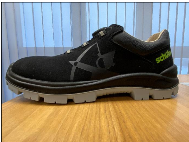
12/2023: neues Schnürsystem

Begründung bei negative Evaluierungsergebnis / Reason for a negative evaluation result: